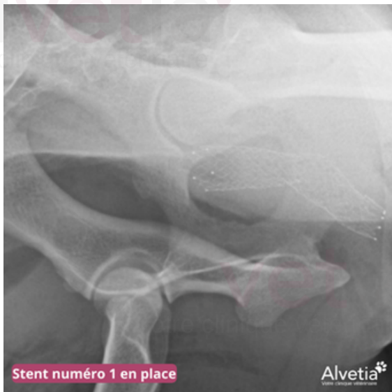
Stent numéro 1 en place