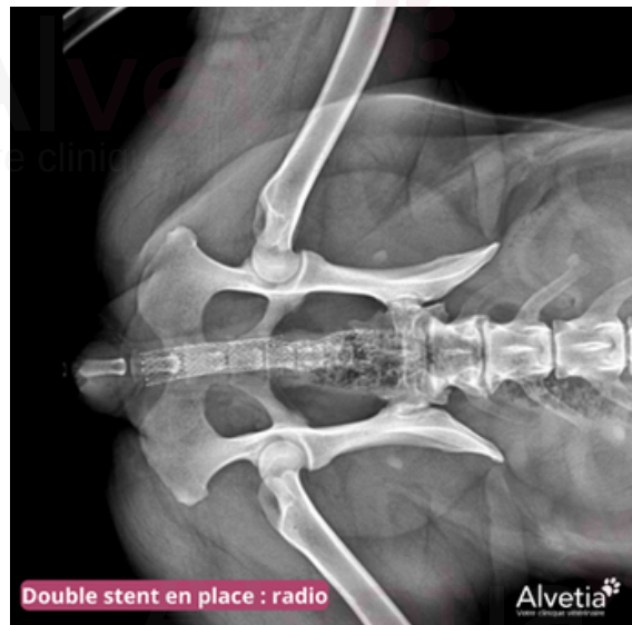
Double stent en place : radio