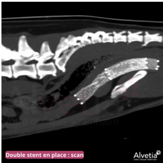
Double stent en place : scan