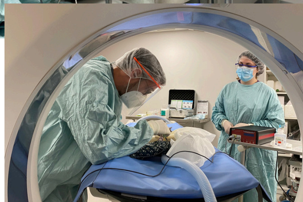
Image 2 - Séance d'électrochimiothérapie avec guidage au scanner