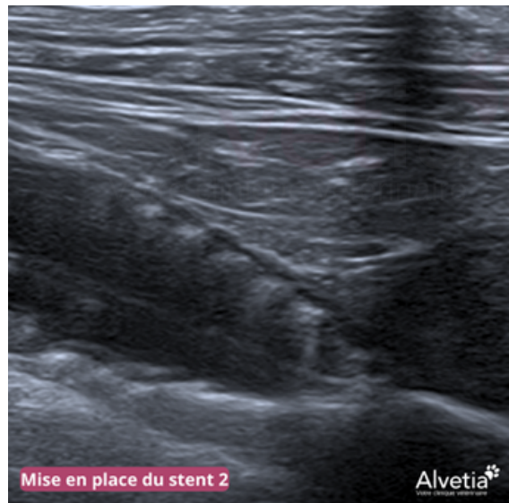
Mise en place du stent 2